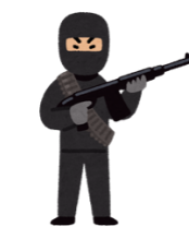
過激化組織 イスラム国(IS)