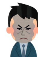
アサド大統領 (シリア)