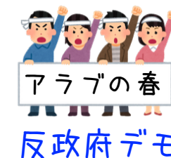
アラブの春 反政府デモ